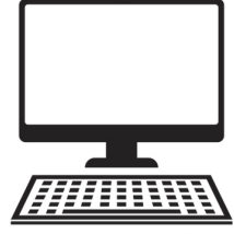
हाम्रो चुनाव चिह्न

नेपाललाई नेपाल नै बनाउन चाहनेजति सबैजनालाई “मौलिक जरोकिलो पार्टी”मा हार्दिक स्वागत छ । नेपाललाई अमेरिकाजस्तो, ब्रिटेनजस्तो, जापानजस्तो, स्वीजरल्याण्डजस्तो, सिंगापुरजस्तो, रसियाजस्तो, चाइनाजस्तो, इण्डियाजस्तो, स्क्वान्डिनेभियन देशहरूजस्तो वा त्यस्तै केहीजस्तो बनाउने भनेर कपूतन्त्रेहरूले दशकौंदेखि सपना बेचेका बेच्यै छन् । कतिवजेल हो नेपालीजनलाई कपूतन्त्रेहरूले ठगिरहने ? जागौं, कपूतन्त्रको समूल अन्त्य गरौं । नेपाललाई नेपाल नै बनाइराखौं । अघि बढौं यो युग हाम्रो हो ।