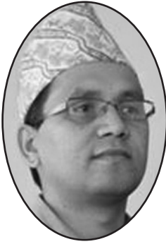
युगद्रष्टा निर्मलमणि अधिकारी